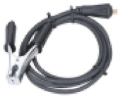
Pinza de tierra