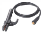
Pinza porta electrodo