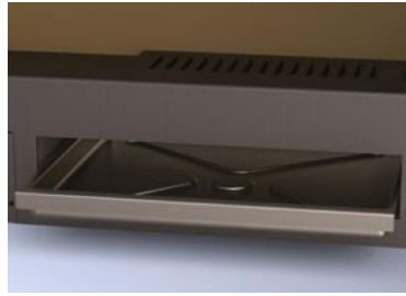
Cajón cenicero extraíble para facilitar la limpieza.