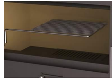
Parrilla de asados desmontable y giratoria de 280x250 mm.