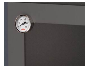
Horno con termómetro de 500 °C para controlar la temperatura.