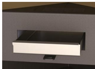
Cajón cenicero extraíble para facilitar la limpieza.