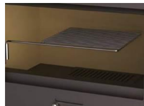
Parrilla de asados desmontable y giratoria de 280x250 mm.