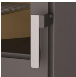
Detalle de manija en inox.

Sistema doble combustión: tecnología por la que, a través de una segunda entrada de aire precalentado en la cámara de combustión, se consigue una segunda combustión de los gases inquemados de la primera combustión, consiguiendo un alto rendimiento de la estufa, gran ahorro en combustible y reducción de emisiones contaminantes.